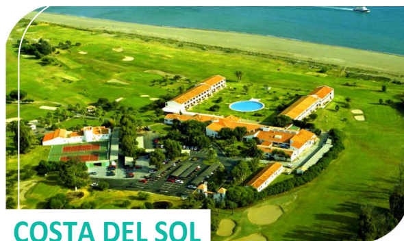
COSTA DEL SOL